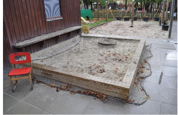
Redskab: Sandkasse Årgang: 2008 Producent: JRJ Ribe Er redskabet mærket: Ja Emne 8: Er der registreret fejl / mangler: Nej