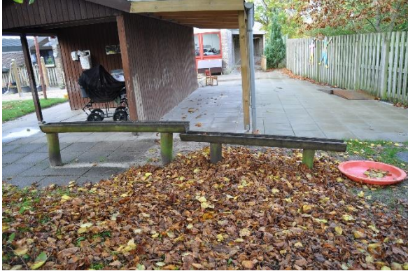
Redskab: Vandleg Årgang: 2017 Producent: Norleg Er redskabet mærket: Ja Emne 7: Er der registreret fejl / mangler: Nej